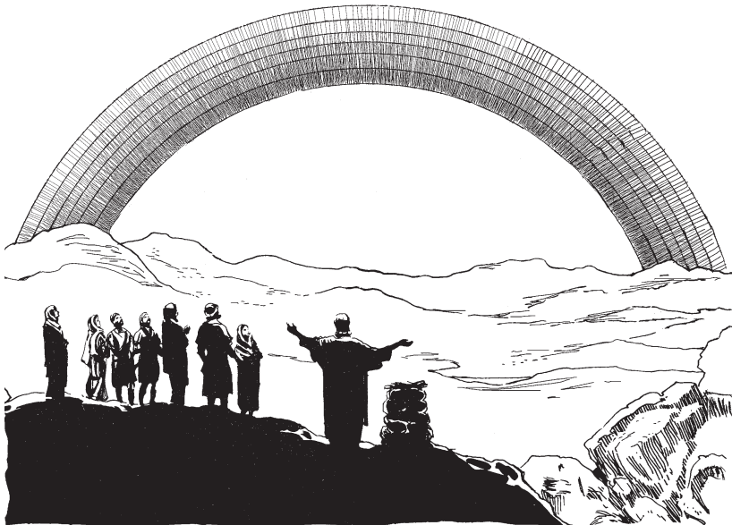
Diosan nón bai naí kuinu mërämia.

12 Ënëx ka a 'unántiokin achúshi ñu mitsubëtan 'akin manutima okin, kamabi ñuina kamabëtan-ribi 'akë 'ikën: 13 'ën kana nón bai naí kuin kamanu anuaxa mëratiokin nan, ax ka achúshi ñu 'ën mibëtan 'akësa 'iti 'ikën. 14 Usa