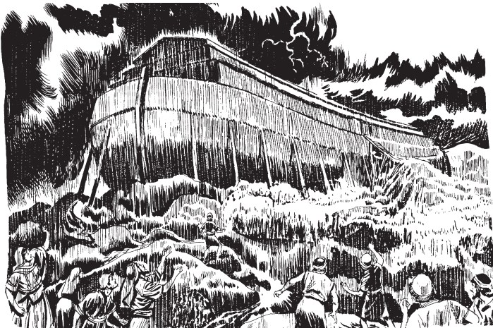
Bakan tita ikuatsinkin kamabi ñu këñuanan uni këñua.

17 Usa 'ain ka baka chaiira 'ëké ax cuarenta nētē 'uñe 'aisamaira 'ibúakëxa. 'Ibúkēbē bakan tita 'ikuatsinkēbē mebi mapurukēbē ka nunti chaiira ax menuax nunkati bēspúruakëxa. 18 Bakan tita 'ëkin abira abi mapurukēbē nunti chaiira axribi, bēspúru nunkákëxa. 19 Chaiira bakan tita 'ëkin ka aín bashi chairukē abi mapurukin me 'aíma 'itánun mapuakëxa; 20 usakin aín bashi-kama maputankëx ka anuishi sēnēnima mapai achúshi 'imainun rabé manámiki bakan tita 'ëi sēnéankësa. 21 Usai 'ikin ka kamabi uni ënē menu tsókē këñuakëxa, ñuina pēchiñu 'imainun 'arakakē ñuina 'arakatima ñuina axa men niríkē ñuina akamax 'ikësaribiti