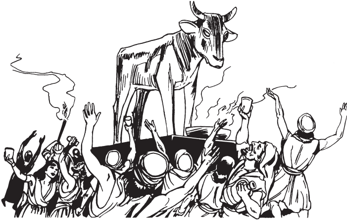
Moisésnën bëtsi ñu rabikankëbëtan anu kuënëokë maxá pará rabé tukibutanun nia.

15 Usa 'ain ka Moisés aín bashi-nuax utëkënkin maxá pará rabé Diosanbia aín bana amo rabébi kuënëoxun usai ax kikësa oí 'iti bana 'inánkë a bëi uakëxa. 16 Ax ka Diosanbi 'akë 'iakëxa 'imainun ka Diosanbia amo rabébi usaía ax kikë-sabi oi 'iti bana kuënëokë 'iakëxa. 17 Usai abë ukín an pain kuankin ka Josuéñen Moisés kakëxa: