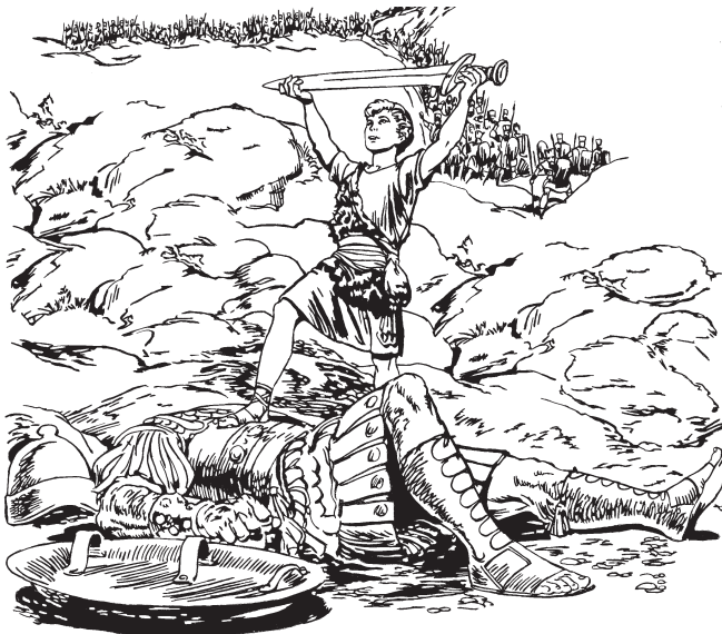
Davidtan Goliat kakē uni tēbíska.

48 Usakin kakēxa Goliat nirukua-tsini a 'urama obētsini ukēbē ka David anuxun 'anux abákiani kuanx a 'urama nirakēakēxa: 49 usai nirakēkinshi ka aín ñusuti nua maxax bikinshi aín shínkatinu 'arukin mañakinshi anun nikin aín bēmánanu Goliat filisteo uni a 'akēxa. Usokin aín bēmanabi pēánkakin 'akēx ka anua nikē anuaxbi aubi bēómēti nipakēakēxa. 50 Usokin ka filisteo uni a Davidnēn 'akēxa. Achúshi shínkati 'imainun achúshi maxax anuínshi ka Davidnēn a uni rētēakēxa. Usakin 'aíkuani ka achúshi manē xētokēbi buanima kuanxun 'akēxa, 51 usakin 'akēxa nipakēkēbē abákiani kuanx filisteo uni