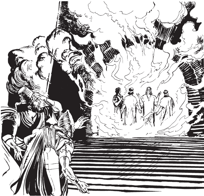
Danielnën 'unankë unikama tsi rëkirukë mëu 'ia bana.

26 Ësai kiküatsini aí ka 'apu Nabucodonosor tsi rëkirukë xëkuë a 'urama oi munuma banai kia-këxa: