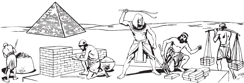
Israel unikama 'aisamaira tëmëramikin ñu mëënun 'amia.

12 Ësakian kakëx ka Israel unibu Egipto mekamanu kuani basi bari abísakëxa, abístankëxun ka basi paxa basi chushikë, 'akësaribi okin 'ati biakëxa. 13-14 Usakian 'aia ka kamabi nëtën an ñu mëia bërúanti faraónën nankë unikaman bënëkin, uiti 'itsa kara