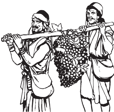
An me ñachai kuankë unikaman bana ñuía.

25 Usakin xukëx kuantankëxun ka achúshi 'uxë 'imainun mapai rabé nëtë 'imi nikin ñachabëtsini amiribishi anua aín patsan bukukë, 26 Cadés kakë anu uni 'ikëma me Parán anubi rikuatiankëxa. Anu ka Moisés, Aarón 'imainun kamabi israel unibu 'iakëxa. Anu bëbatankëxun ka uisa kara a mekama 'iaxa a 'imainun an buánkë bimi akama ismianan a menu 'ikë unibu isbiankë akamabi Moiséskëñun israel unibu ñuixuan-këxa. 27 Ñuixunkin ka ësokin Moisés kakëxa: