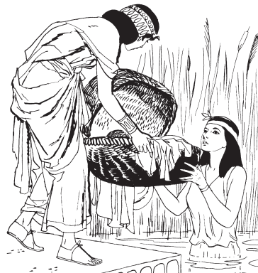
Baka kuëtsin bëspunkëa tasánua tuá bia.

5Usakian 'akē 'aínbi ka a nētë xupibukëbë Egíptonu 'ikē 'apun bëchikē xanu chipash 'imainun an ñu 'axunkē xanukama nashi kuankëxa, kuantankëx baka kuëbí nikinbi ka xanu achúshinën, basion xo chaxkébu bakanua kookë tēmú bëspúkē tasá mërakëxa. Usakin