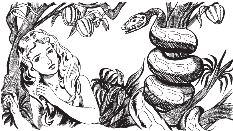
Xanu runun paránkēx 'ucha.

3 1 Nukēn 'Ibu Diosan uniokē bētsi ñuina raekēma kamasamaira ka runu 'iakēxa, usa 'ixun ka xanu ñukákēxa: