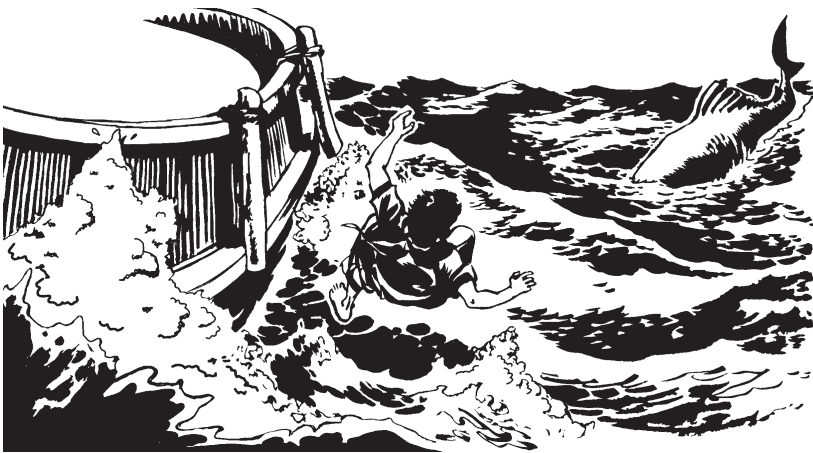
Jonás parumpapanu nia.

15 Ĕsai pain kitankēxun ka Jonás bitankēxun parúmpapanu