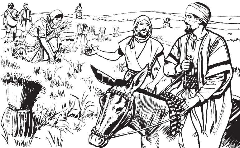
Rut Booznën naënu 'ia.

—Kamina ësokin mi kamainun kuati 'ain, usa 'ain kamina bëtsi unin naënu ñu 'apákë aín bimi