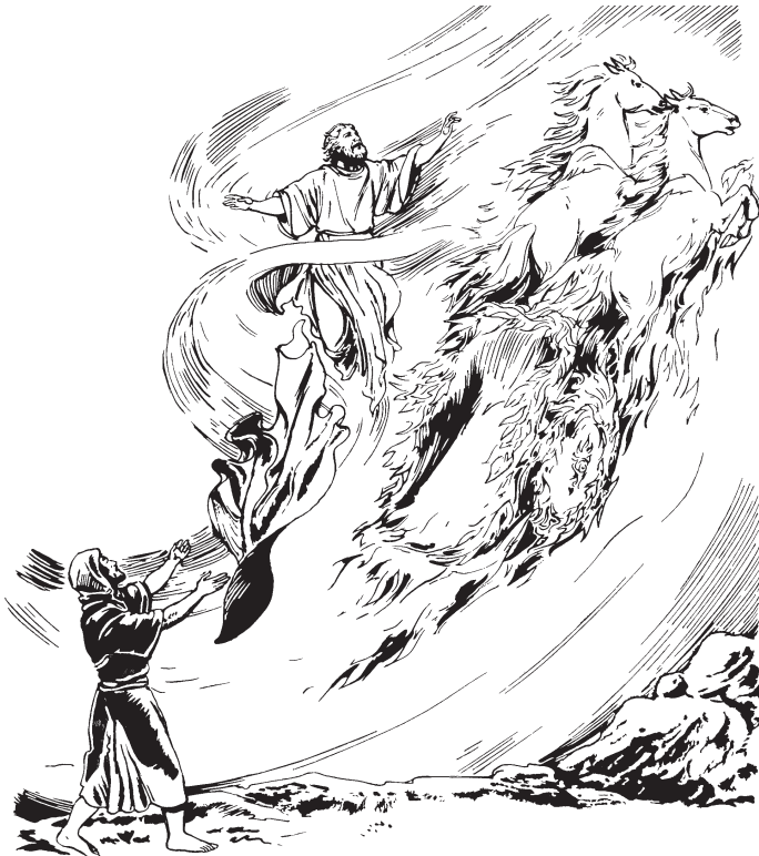
Elías naínu kuan.

11 Ésai kia a rabëtax kanankiani kuankëbëbi ka Diosanbi 'imikëx, bënëtishi achúshi caballonan nirinkë anu tsi rëkirukësa 'imainun caballonuribi tsi rëkirukësa ax mërakëxa, mërakëbëa Elías abë énanani anu