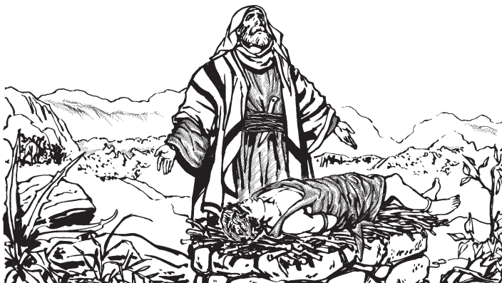
Diosan Abraham asérabi kara ami sinania isnuxun tan.

9 Anu kuanuan Nukën 'Ibu Diosan kakë matá me anu bëbaxun, ka Abrahamnën anuxun ñuina xaroti maxax bukunruakëxa; usakin bukunrutankëxun ka karu-ribishi tíkati mabukuntankëxun aín bëchikë Isaac aribi nëakëxa, nëaxun ka anu ñuina xarotinu nankë karu kamanan; 10 rakankëxa rakamainun ka aín manë xëtókë bikian aín bëchikëmi okin sananiabi ka 11 nukën 'Ibu ángelnën kuënkín nañuxun kakëxa: