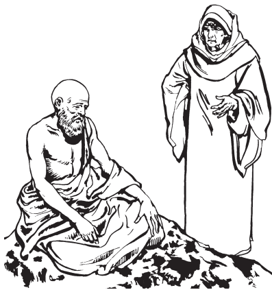
Job 'imainun ain xanu 'ia.

—¿Ësai 'insíanx tëmëraibi kaina mix ñunshinakëti Diosmi