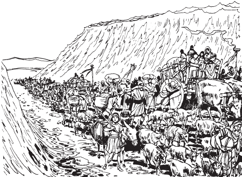
Amo rabé chairui me rakatanun parumpapa tëara-bëkëbë israel unikama sikarakëa.

rabé okin kuinan pékakëx ka israel unikamax xabánu 'iakëxa, 'imainun ka egipcio suntárukama ax iménu 'ixun iskasmakin a imé israel unikama nukunun nukumiama 'ikën. 21 Usa 'ain ka Moisésnën aín tatsi bikin Nukën 'Ibun kakësabiokin parúmpapami okin sanankëxa, usokëbëtainshia Diosan 'imikëx ka amiaxa bari urukë amiax a imé suñu kushi bëquinëakëxa. Usai 'ikëbë ka parúmpapa nëbëtsi baka ënanani amo rabé chairra 'inun panárabéakëxa. Usakin Nukën 'Ibun 'imikëbë ka me ëski raka-këxa, 22 usai baka panárabëti amo rabé chairui mëmiu 'ianan mëkeu 'i me ëskikëbë ka anun israel unikama sikarakëkankëxa.