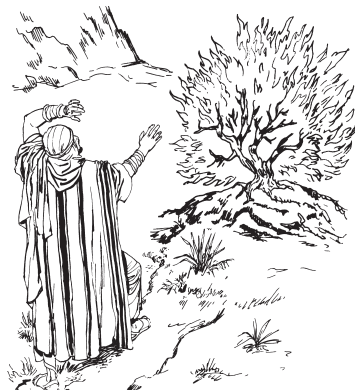
I muxañu pëñanankëkë nëbëtsinuax tsi rëkirukësa 'inun Diosan ángel mërá.

3 1 Moisésnën ka aín kuku Jetró 'ikëbi Reuel kakinribi anëkë uni an 'arakakë ovejakama bërúanxuanakëxa, a unix ka sacerdote Madián kakë me anu 'ikë 'iakëxa, achúshi nëtën ka anu uni 'ikëma menu aín kukun ñuina 'arakakëkama buani kuankëxa, kuanx ka Diosan bashi kakë chairukë anu bëbakëxa ax ka Horeb kakë 'iakëxa. 2 Anuax ka Nukën